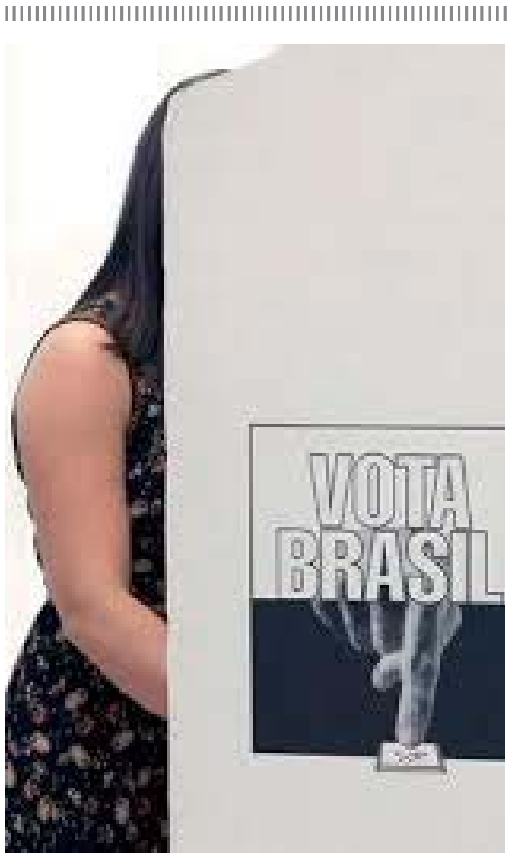
Convocados para trabalhar em novembro