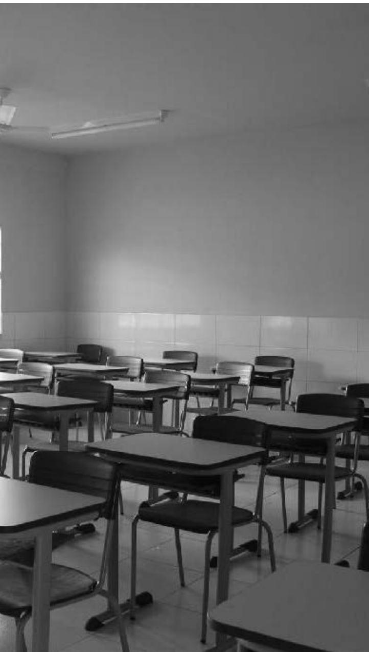
Aulas serão retomadas no dia 8 de fevereiro

O secretário destaca que a enquete e as discussões com representantes de sindicato, comissões e políticos têm o objetivo de saber qual é a análise feita pela sociedade. “A decisão final será tomada levando em consideração a opinião de pais e responsáveis pelos alunos, a dos profissionais que estarão nas escolas, dos representantes da sociedade e os dados da Covid-19. (...) O ensino presencial é indispensável, principalmente na fase da alfabetização, mas este retorno só ocorrerá de forma totalmente segura”.