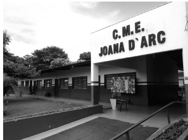
Aulas presenciais foram suspensas em março do ano passado

fechar a formação das turmas. “Sabemos que alguns lugares teremos demanda de vagas e de alunos, em outros lugares mais vagas e nem tantos alunos. Então vamos consorciar bem isso en-